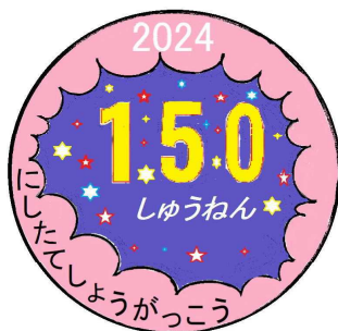
3年 羽沢 向葵