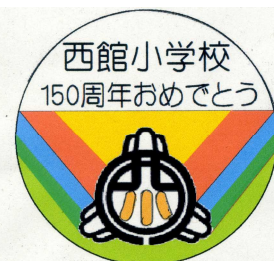
5年 金谷 奏汰